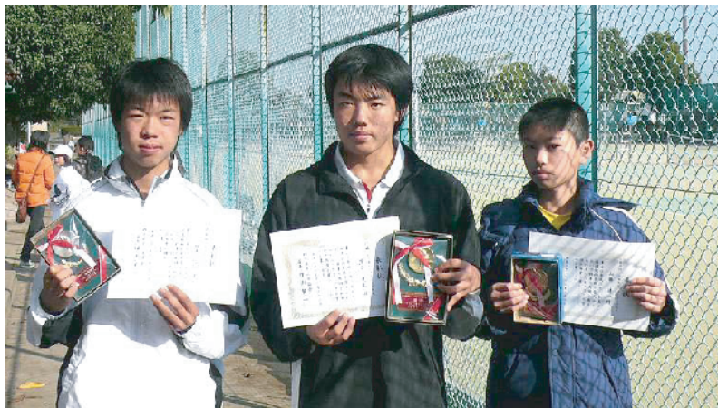
1 4 歳以下男子