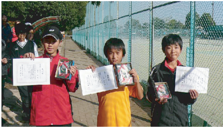
1 2 歳以下男子