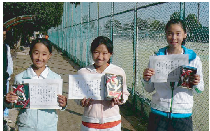
1 4 歳以下女子