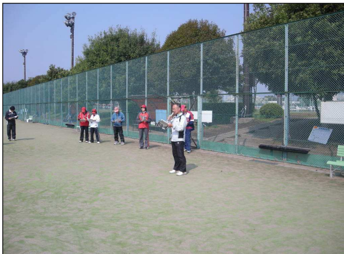
大会初日開会式:ディレクター挨拶