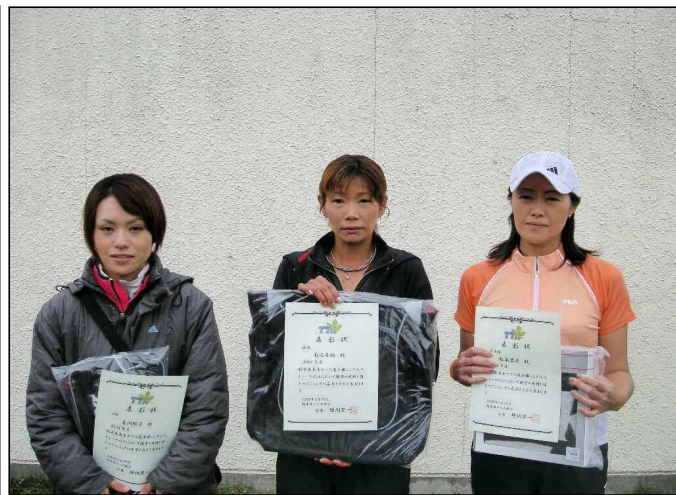
一般女子ATベスト4入賞