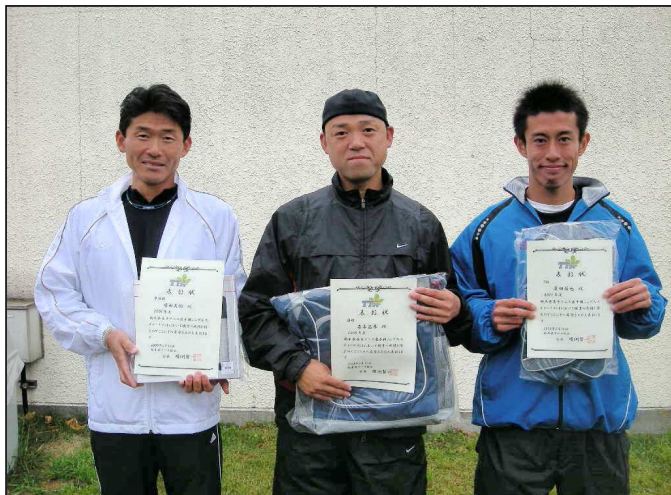
一般男子ATベスト4入賞