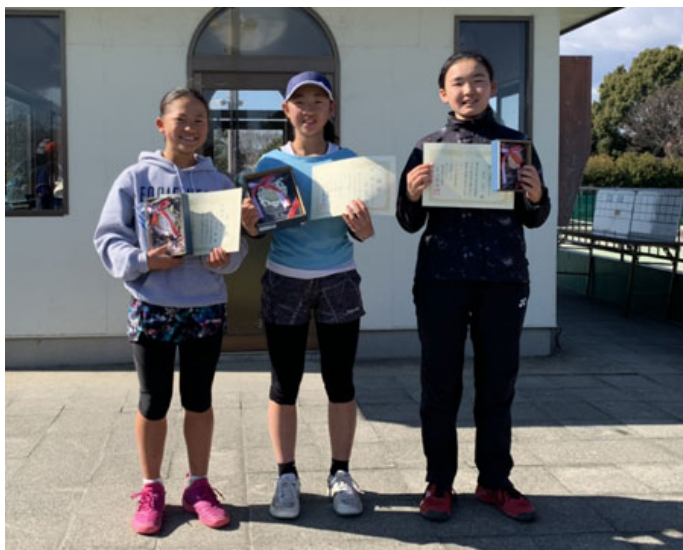
14歳以下女子 準優勝 優勝 3位