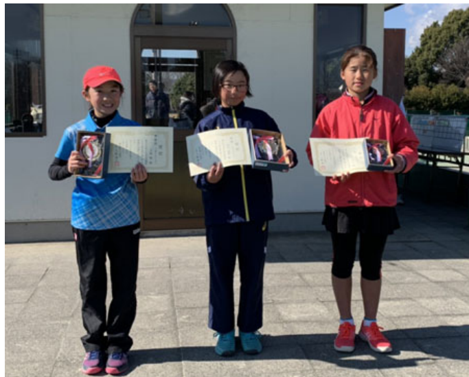
12歳以下女子 準優勝 優勝 3位