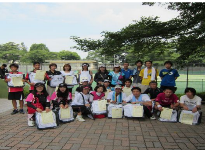
男女Bトーナメント各ブロック優勝