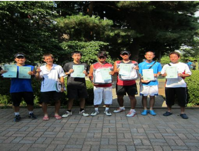
男子Aトーナメントベスト4入賞選手