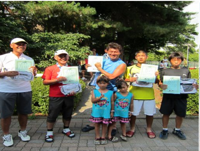
男子B級トーナメントベスト4入賞選手