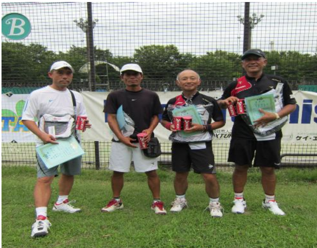
男子45歳優勝・準優勝 入賞 選手