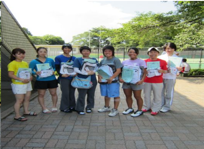
女子Aトーナメントベスト4入賞選手